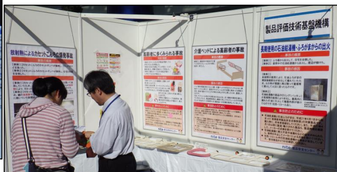
ブースでの説明の様子